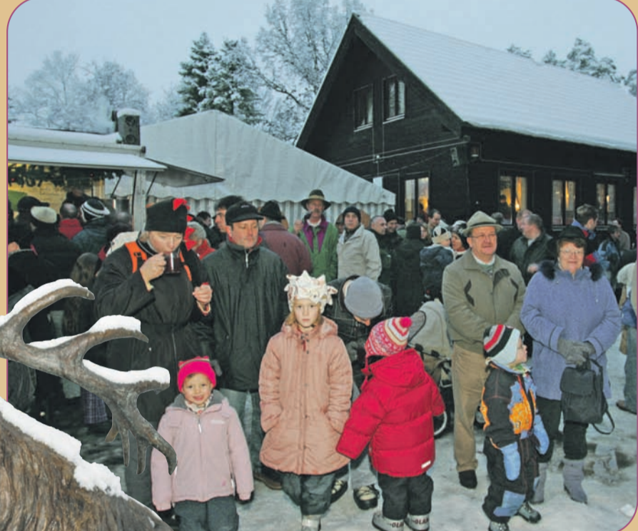
Text: mwa/ Bild:

Ein Shuttle-Service bringt die Besucher an beiden Tagen im halbstündlichen Rhythmus zum Weihnachtsmarkt und zurück. Der Markt ist an beiden Tagen bis 19 Uhr geöffnet und beginnt am Samstag um 13 Uhr und am Sonntag bereits ab 11 Uhr. Der Veranstalter empfiehlt, wegen fehlender Parkplätze den Shuttle-Verkehr zu nutzen.